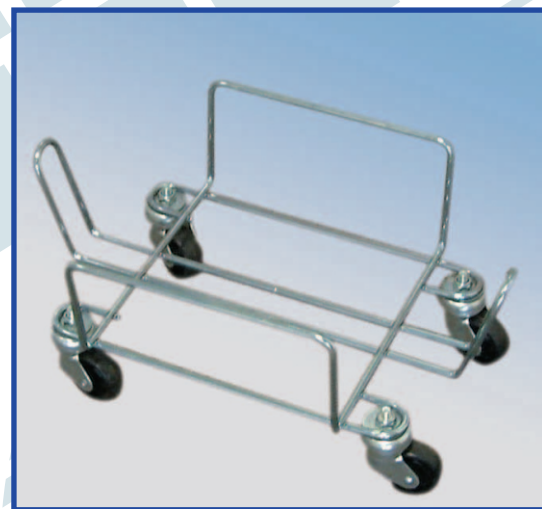
COD. 01.91.000.57 PORTA CESTINO CON RUOTE idoneo per cestini lt 20 e lt 28