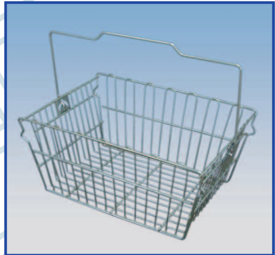
COD. 01.90.000 CESTINO SPESA IN FILO metallico lt. 20 Finitura: zincocromatura brillante