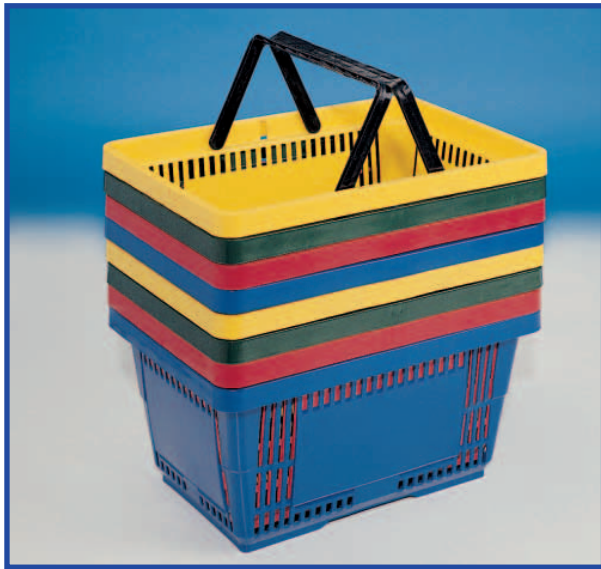
COD. 01.95.000.00 CESTINI SPESA PLASTICA lt.28 n.2 manici