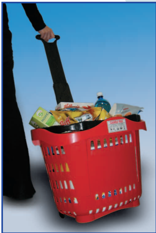
COD. 01.88.000.00 CESTINO SPESA TROLLEY lt 43 con ruote e manico telescopico