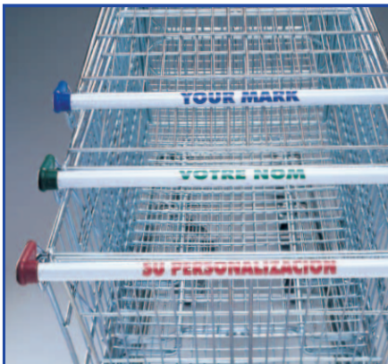
COD. 01.00.012.00 PERSONALIZZAZIONE MANICO