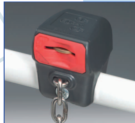
COD. 01.MDCS. LUCCHETTO CAUZIONALE da 0,50 - 1 - 2 EURO